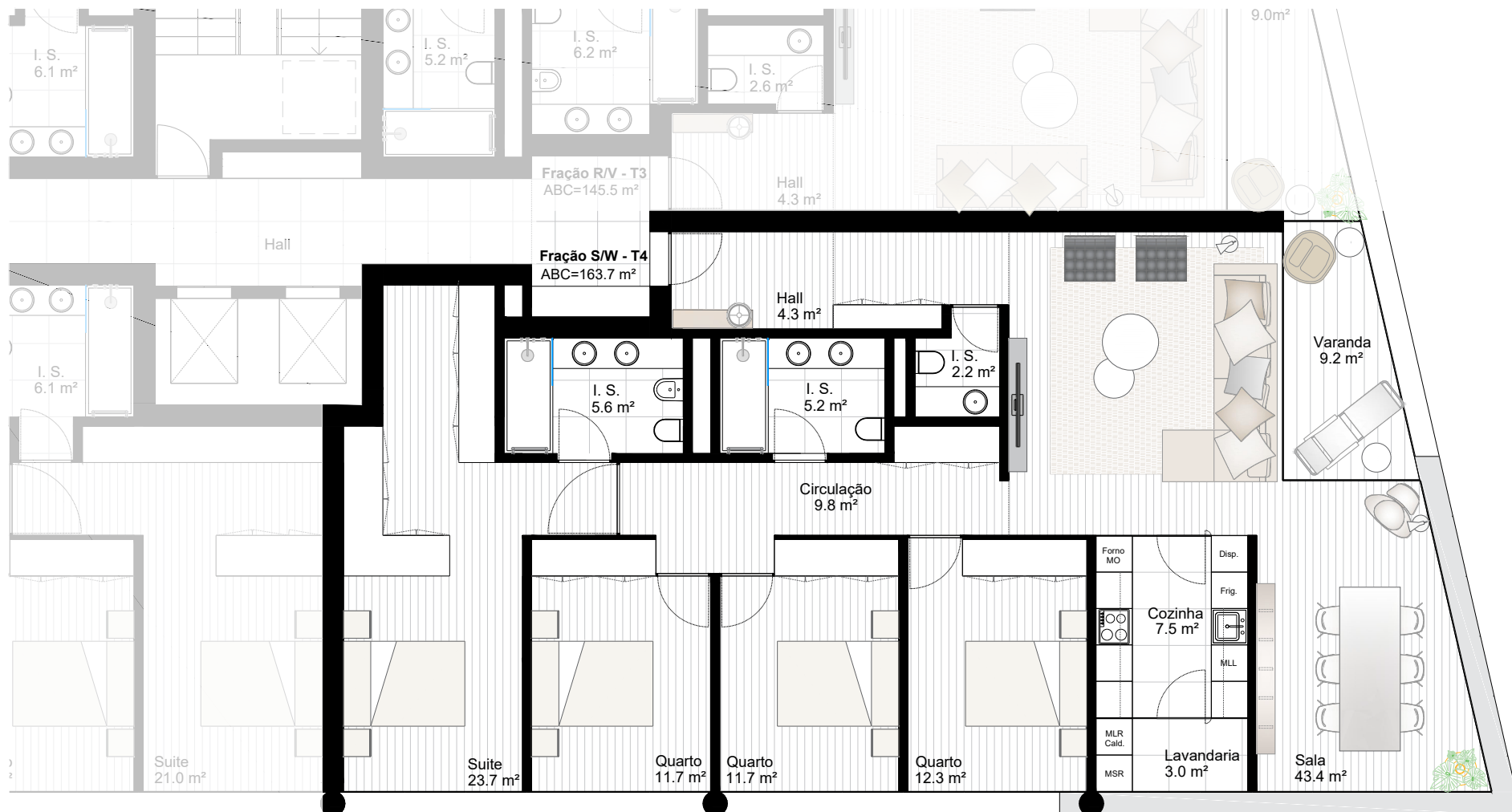
Planta Piso 3 e 4 escala 1:100