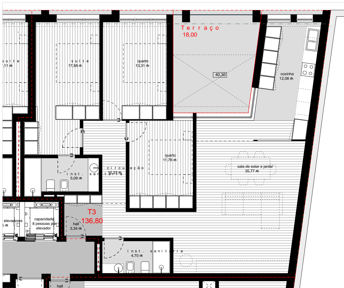
Planta - Piso 2 escala 1:100